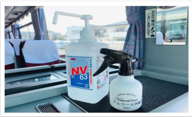
バス乗降口にアルコール消毒液の設置