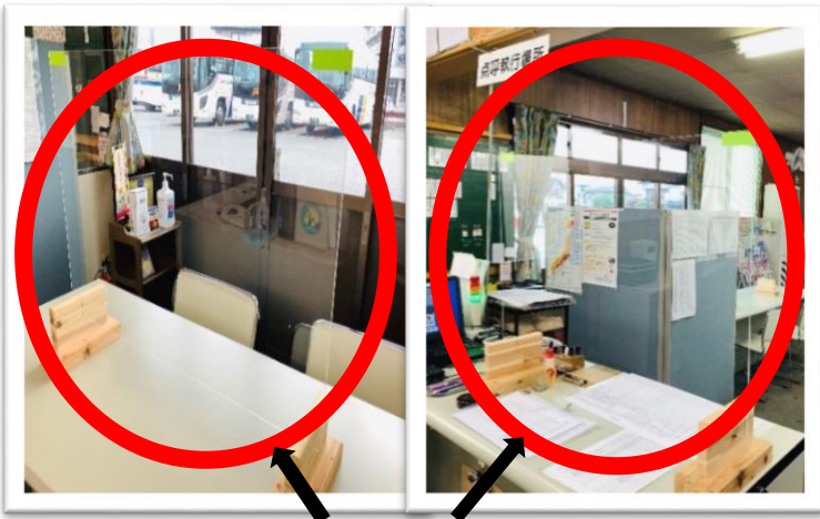
点呼場及び接客カウンターに 飛沫感染防止対策としてアクリル板を設置