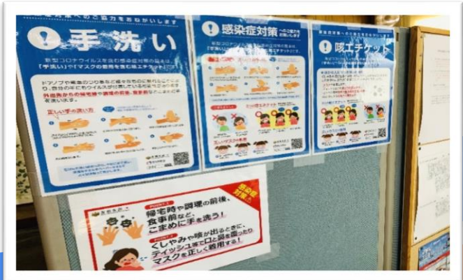
従業員への注意喚起