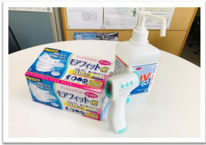
点呼時に健康状態、体温のチェック