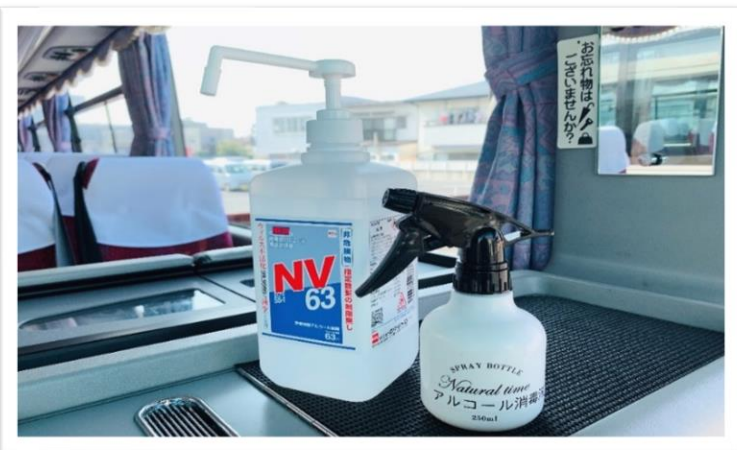
バス乗降口にアルコール消毒液の設置