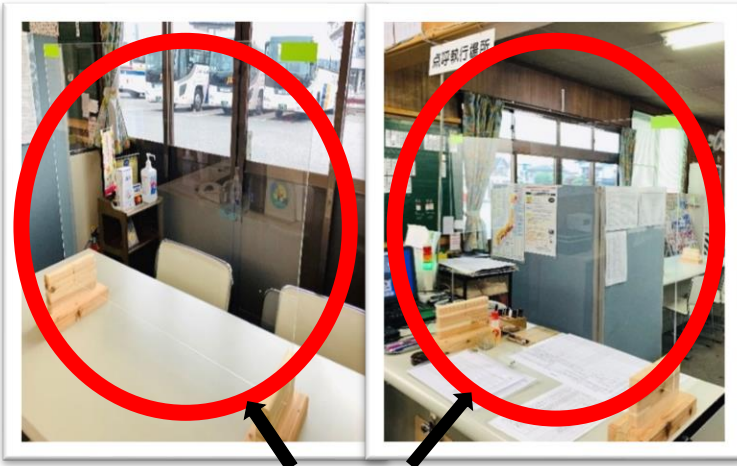
点呼場及び接客カウンターに 飛沫感染防止対策としてアクリル板を設置