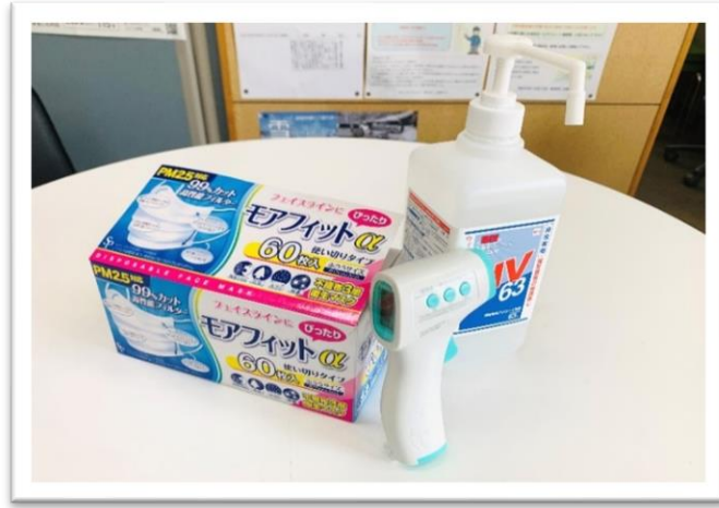
点呼時に健康状態、体温のチェック