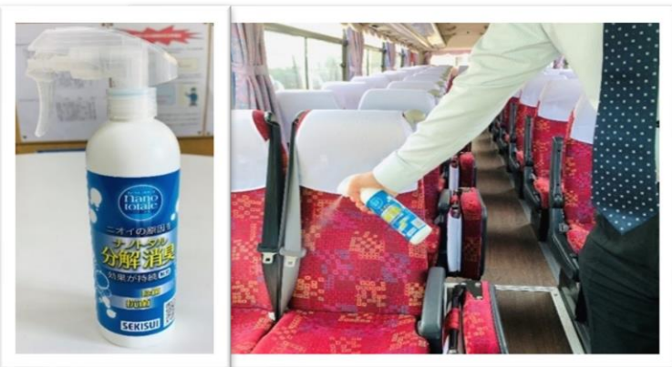
除菌・抗菌スプレーによる車内消毒