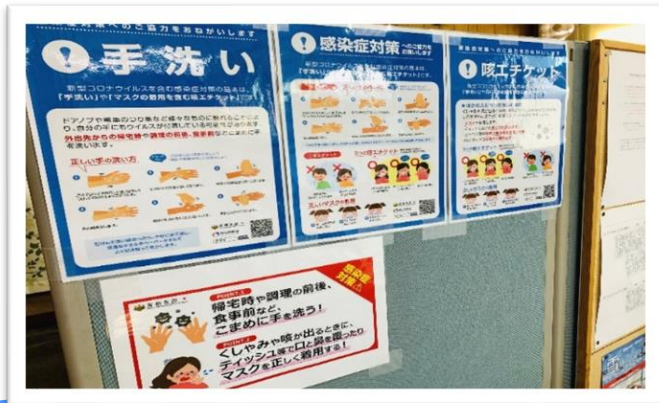
従業員への注意喚起